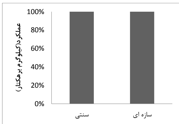
شکل (۵): عملکرد تولید محصول در دو روش آبیاری سطحی سنتی و سازه ای

در شکل (۵) برای مقایسه بهتر، عملکرد محصول به دست آمده در دو روش آبیاری مقایسه شده است.