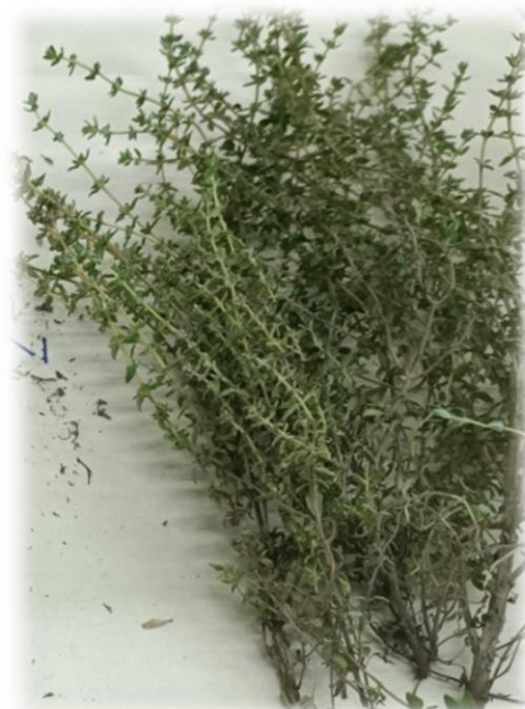
شکل (۱): ویژگی‌های مورفولوژیک آویشن باغی (سمت راست) و شیرازی (سمت چپ) در مراحل انتقال نشا (بالا) و پس از برداشت (پایین).