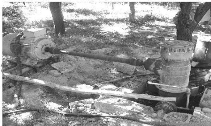
شکل (۲): نامناسب بودن فونداسیون مورد استفاده در ایستگاه‌های پمپاژ برقی

میانگین عملکرد محصول سیب‌زمینی در دو سیستم آبیاری نشتی و بارانی به‌ترتیب 43/5 و 51/5 تن در هکتار مشخص شد، دامنه تغییرات کارایی مصرفی آب در سیستم نشتی از 1/7 تا 6/4 کیلوگرم بر متر مکعب و بطور متوسط 3/1 کیلوگرم بر متر مکعب بود. قدمی فیروزآبادی و سیدان ( 1385 ) میزان آب مصرفی در مزارع نشتی سیب‌زمینی را 10802 متر مکعب در هکتار برآورد نمودند. آن‌ها دامنه تغییرات کارایی مصرفی آب محصول سیب‌زمینی را در سیستم آبیاری نشتی 1/2 تا 2/4 کیلوگرم بر متر مکعب برآورد نمودند. در سیستم آبیاری بارانی میزان کارایی مصرفی آب از 3/7 تا 10/2 کیلوگرم بر متر مکعب و بطور متوسط برابر با 6/5 کیلوگرم بر متر مکعب بود (جدول ۵).