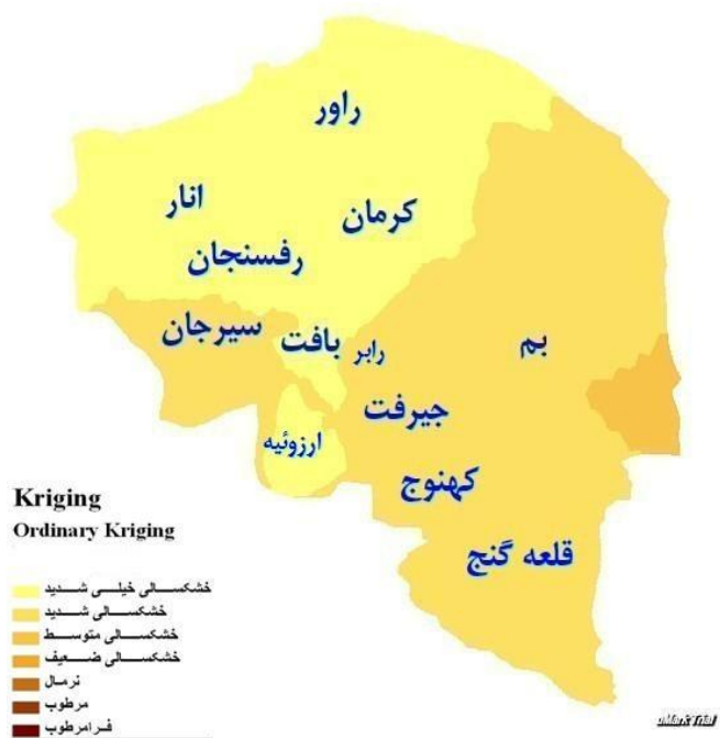
شکل (۵): نقشه پهنه‌بندی خشکسالی استان کرمان در سال ۱۳۸۴ بر اساس مدل کریجینگ