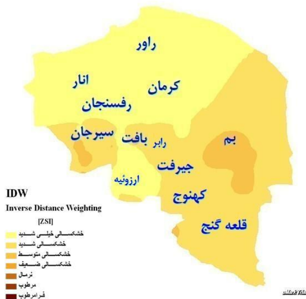
شکل (۷): نقشه پهنه بندی خشکسالی استان کرمان در سال ۱۳۸۴ بر اساس مدل عکس فاصله