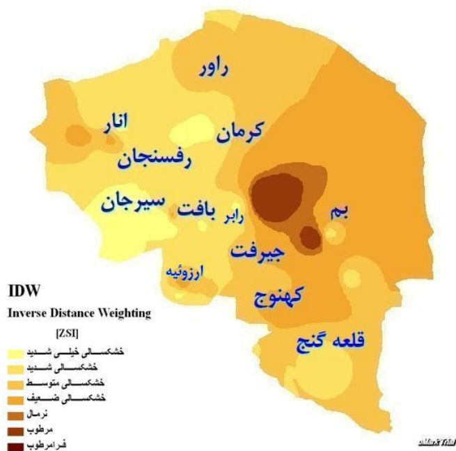
شکل (۴): نقشه پهنه‌بندی خشکسالی استان کرمان در سال ۱۳۶۷ بر اساس مدل عکس فاصله