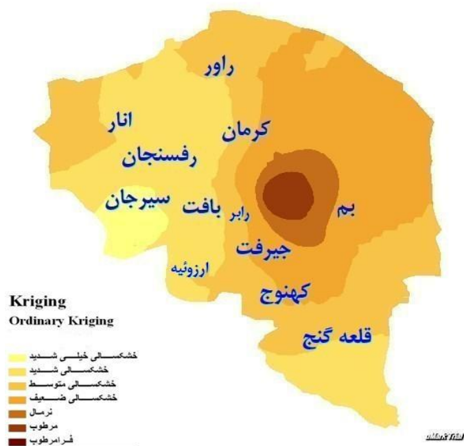
شکل (۲): نقشه پهنه‌بندی خشکسالی استان کرمان در سال ۱۳۶۷ بر اساس مدل کریجینگ