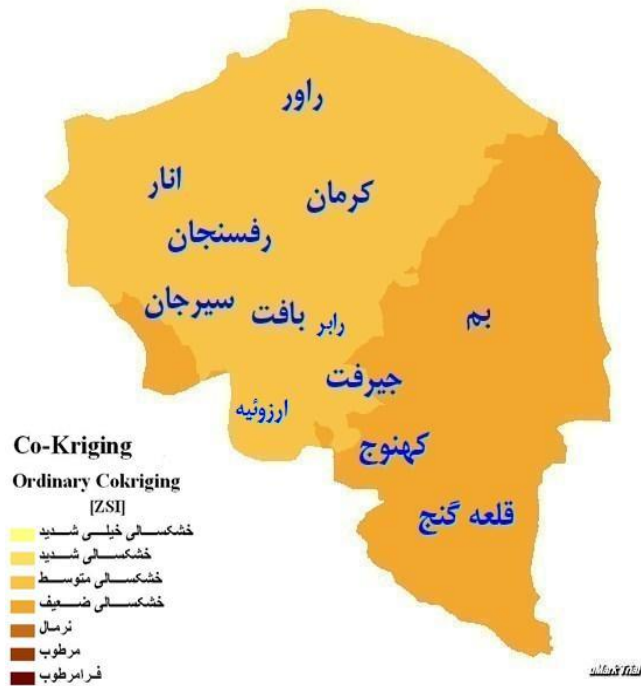
شکل ۶: نقشه پهنه بندی خشکسالی استان کرمان در سال ۱۳۸۴ بر اساس مدل کوکریجینگ