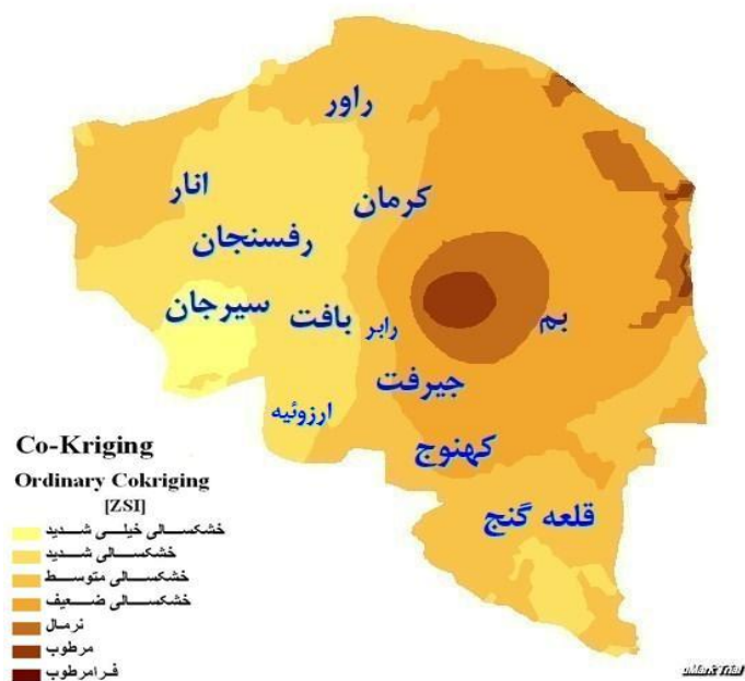
شکل (۳): نقشه پهنه‌بندی خشکسالی استان کرمان در سال ۱۳۶۷ بر اساس مدل کو کریجینگ