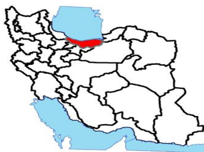
شکل ۱- محدوده مورد مطالعه

در یک جمع‌بندی می‌توان به این نتیجه رسید اگر چه مطالعات در این حوزه خاص و به این شیوه مطالعه تا به حال انجام نشده است اما مطالعات مذکور با فراهم کردن زمینه‌های نظری مدیریت بهینه مصرف منابع آب در کشاورزی، بستر مناسبی را برای مطالعه چالش‌ها و شناسایی الزامات مدیریت بهینه مصرف آب